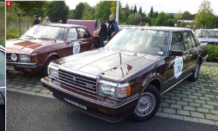
5 | Bijna uitgestorven Dinosaurus. Met de Kapitän, Admiral en Diplomat B (afgebeeld) nam Opel het van 1969 t/m 1977 op tegen de gevestigde orde uit Stuttgart. Vrij zinloze moeite. 6 | Ongelooflijk, daar heb je er nog eenje... En wat voor een! Toyota Crown van de 7e generatie (1983-1987), in schitterende staat. 7 | Toch nog een snelheidsmoment. 'Verd... Hier was ik vroeger altijd zo goed in!'