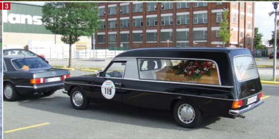
1 2 3